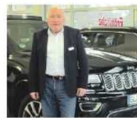
Mein Team und ich freuen uns auf Ihren Besuch!

Autohaus Katzner blickt auf eine fast 40-jährige Geschichte zurück und ist heute mit 5 starken Marken, einer voll umfänglichen Werkstatt und einer Lackiererei vertreten. Das Team vom Autohaus Katzner steht kompetent an Ihrer Seite, wenn es um Serviceleistungen, Verkauf oder attraktiven Finanzierungsmöglichkeiten für den Kauf eines Neu- oder Gebrauchtfahrzeugs geht.